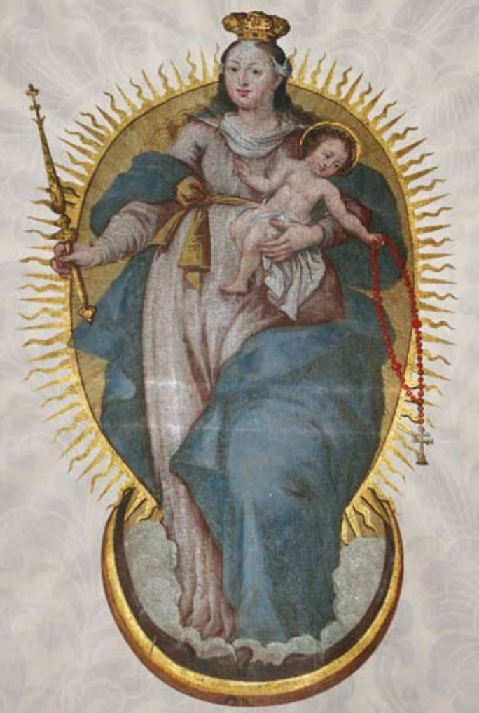
progetto grafico YVOUSTUDIO

Bormio | Livigno | Sondalo | Valdidentro | Valdisotto | Valfurva luglio-agosto 2010